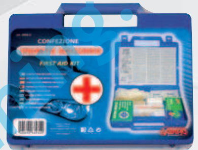
66960 Valigetta / Case 24