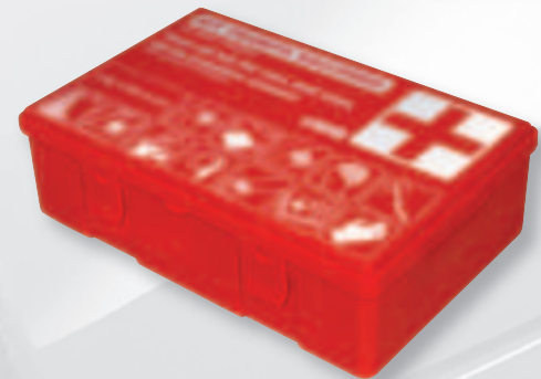
66963 Valigetta / Case 10