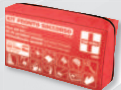
66962 Busta nylon / Pouch 9