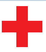
TRIX, CASSETTA PRONTO SOCCORSO TRIX, FIRST-AID KIT